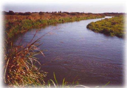
Grønbæks lille høl