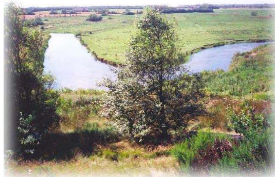
Et af de store sving med dagvand

Som lystfisker gælder det om at kunne læse vandet og dermed finde frem til havørredens standpladser.