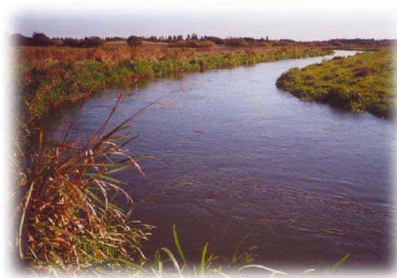
Grønbæks Store Høl, som er 3,85 m dyb

Udsigt over Karup Å, som giver en fascinerende stemning, uanset om det er forår, sommer eller efterår. Området er et eldorado for lystfiskere, som kommer år efter år. Åen er kendt for sin rige fiskebestand af havørreder.